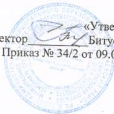
График оценочных процедур в МБОУ ЗОССОШ 2022-23 учебном году